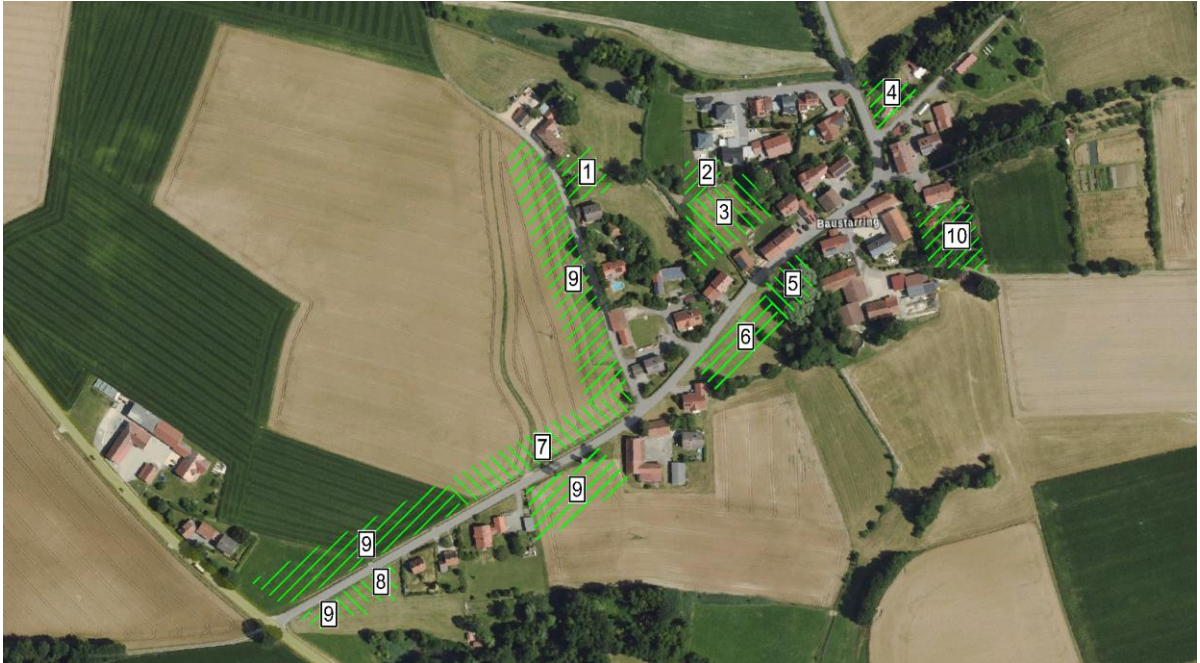
Abb. 2 Flächenanalyse Ortschaft Baustarring, Gemeinde Kirchberg; Aufrufdatum 24.02.2023, unmaßstäblich

Ort zu halten und der Überalterung der Bevölkerung entgegenzuwirken. Das geplante Baurecht ist für junge Familien des Privatgrundstücks vorgesehen. Aus diesen Gründen sollen die Gartenflächen in Anspruch genommen und nachverdichtet werden.