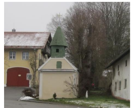
Westansicht Ortskapelle