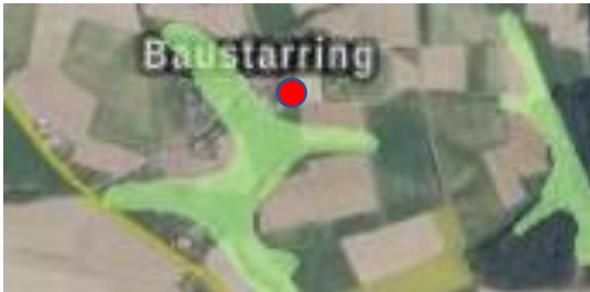
Abb. 4: Wassersensibler Bereich (hellgrüne Flächen), ohne Maßstab.

Gemäß Auswertung des Bayernatlas/ Naturgefahren/ Hochwasser liegt der Geltungsbereich nicht innerhalb eines festgesetzten oder vorläufig gesicherten Überschwemmungsgebietes. Darüber hinaus lässt sich festhalten, dass in Teilen von Baustarring ein wassersensibler Bereich verzeichnet ist. Allerdings liegt das Satzungsgebiet nicht innerhalb eines wassersensiblen Bereichs. Wassersensible Bereiche sind Gebiete, die durch den Einfluss von Wasser geprägt sind. Hier sind Überschwemmungen bzw. hohe Grundwasserstände möglich.