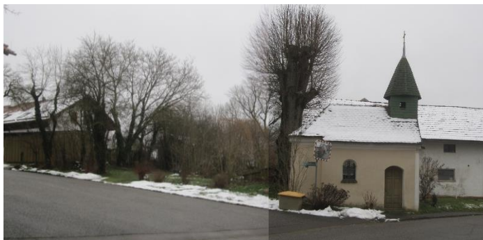
Abb. 3: Panorama-Nordansicht: links Haus-Nr. 5, rechts Ortskapelle

Das Baudenkmal mit der Nummer D-1-77-124-4, die Ortskapelle in Baustarring, befindet sich knapp 50 m in Nordwest-Richtung entfernt. Sie liegt außerhalb des Satzungsgebiets und wird von der Planung nicht berührt. Sichtachsen zum Baudenkmal werden nicht tangiert, da die Bauhöhe der Kapelle die Umgebung nicht überragt. Außerdem ist das Plangebiet durch eine bestehende Baumhecke von der Kapelle optisch abgegrenzt.