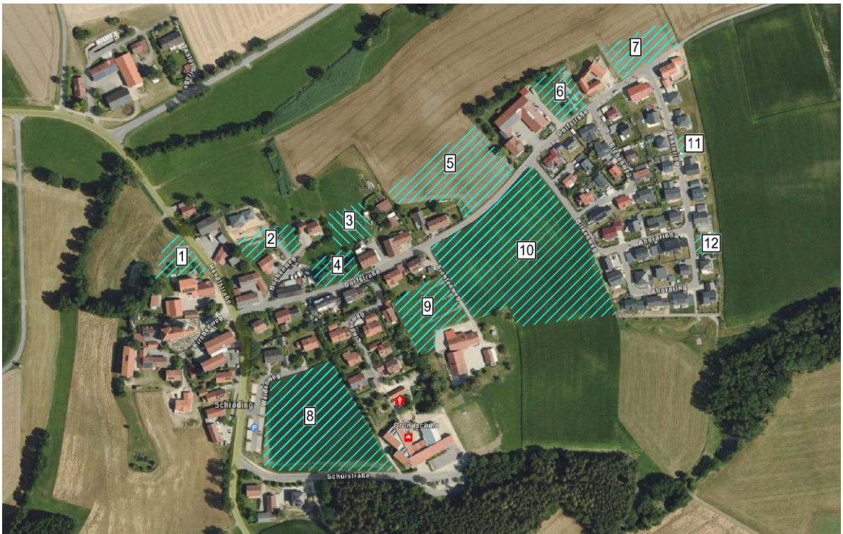
Abb. 3: Flächenanalyse Ortschaft Schröding, Gemeinde Kirchberg, Aufrufdatum 24.02.2023, unmaßstäblich